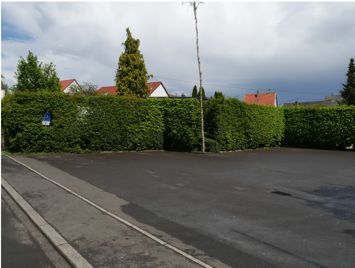
Dorfplatz in Dörrebach (2017)