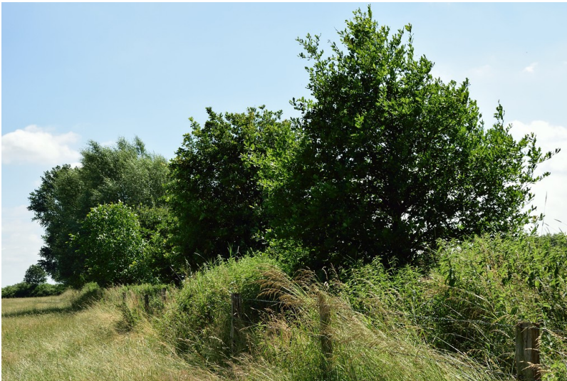
Kopfeichenreihe am Biener Altrhein (2016)