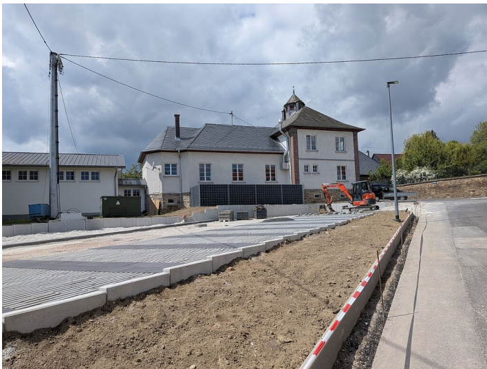
Das Volkshaus in Dörrebach mit Parkplatz im Mai 2026