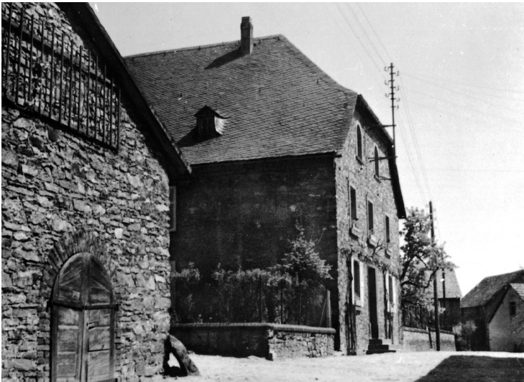
Die beiden Zehntscheunen in Dörrebach, von der Schloßstraße aus (1920er Jahre)