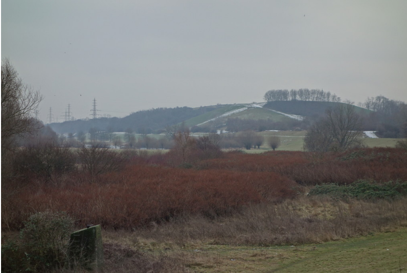
Halde Rockelsberg (2016)