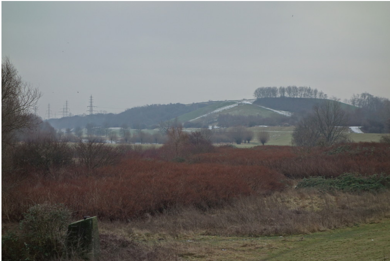
Halde Rockelsberg (2016)