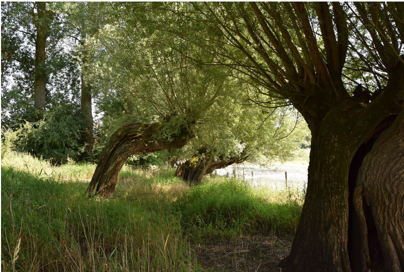
Kopfweiden mit Höhlen und Spalten am Reeser Altrhein (2016)