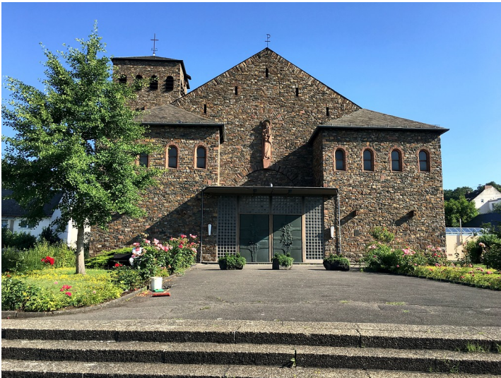
Katholische Barbarakirche in Niederlahnstein (2016)