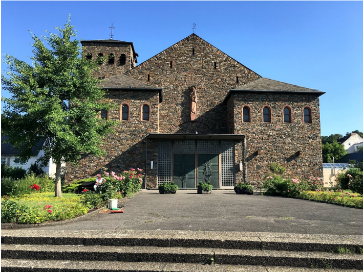
Katholische Barbarakirche in Niederlahnstein (2016)