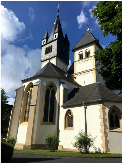
Katholische Pfarrkirche St. Martin in Oberlahnstein (2016).