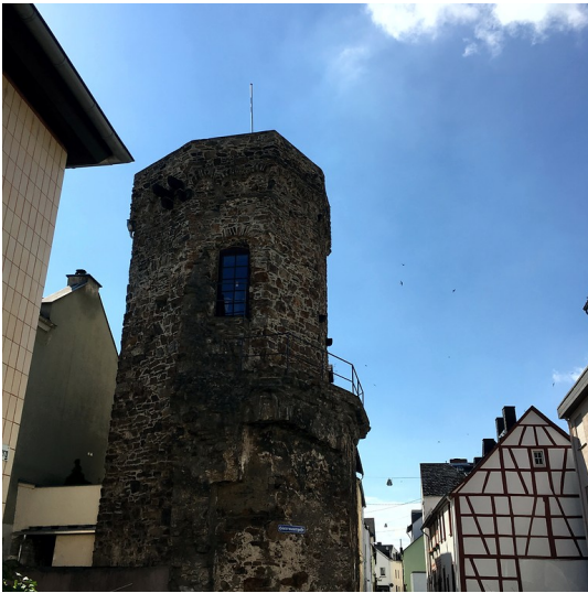
Bürgerturn in Oberlahnstein (2016)