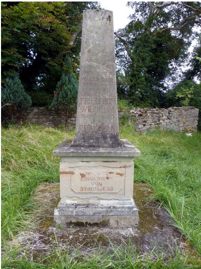
Detailansicht des Gauvain-Denkmals an der Burg Gollenfels (2016).