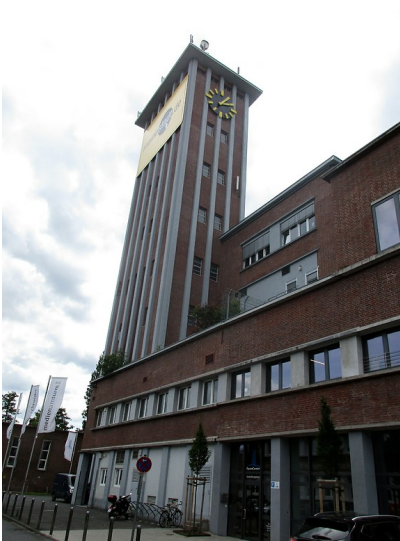
Der markante Turm im Süden des früheren Zentralgebäudes der ehemaligen Zellwolle-Werke "Phrix" der Rheinischen Zellwolle AG in Siegburg (2016).