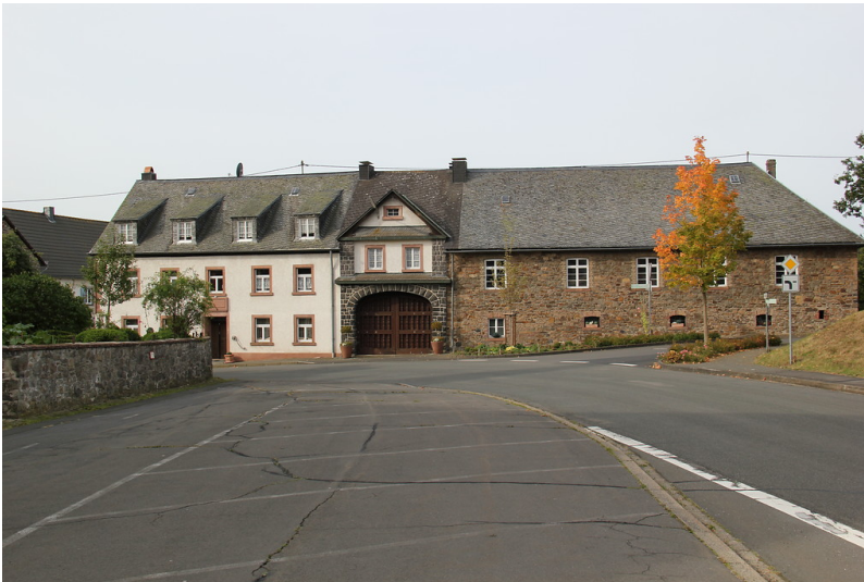
Gutshof Emmerich mit Zehnscheune in Ueß (2012)