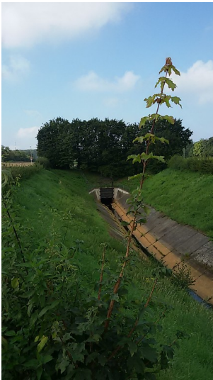
Kölner Randkanal (2015)