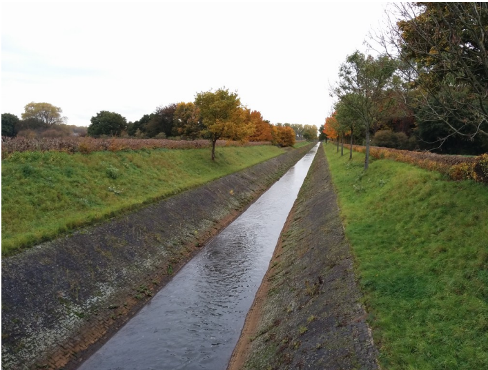
Der Kölner Randkanal entstand in der zweiten Hälfte der 1950er Jahre. Er fasst in einem gemauerten Kanal die Sumpfungswässer des Braunkohlentagebaus sowie Oberflächenabflüsse (2015).