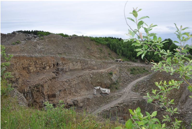
Abbaubereich der Firma Quirrenbach im Steinbruch Brungerst, Lindlar (2014)