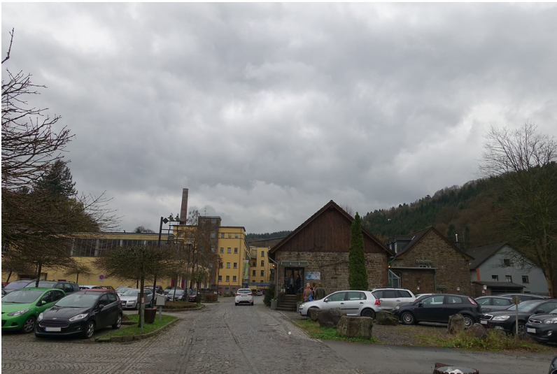
Blick über die ehemaligen Eisenbahntrasse zu den Gebäuden der ehemaligen Textilfabrik Ermen & Engels, Engelskirchen (2015)