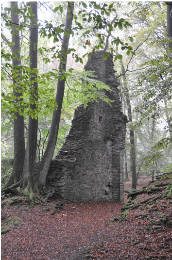
Reste der ehemaligen Hauptburg Neuenberg, Eingang zur Burg/Torbau (2014)