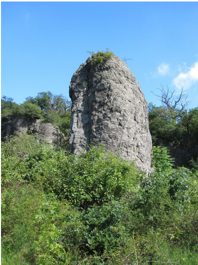
Ein frei stehender "Campanile" im Steinbruch Stenzelberg im Siebengebirge (2010).

Bundesland: Nordrhein-Westfalen, Rheinland-Pfalz