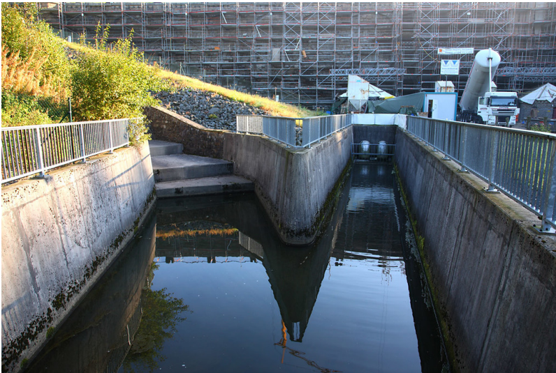
Betriebsablass der Lingesetalsperre (2008)