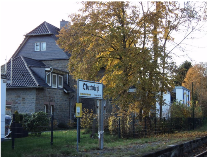
Rückseite des Bahnhofs Oberwiehl (2015)