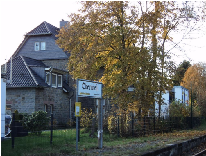
Rückseite des Bahnhofs Oberwiehl (2015)