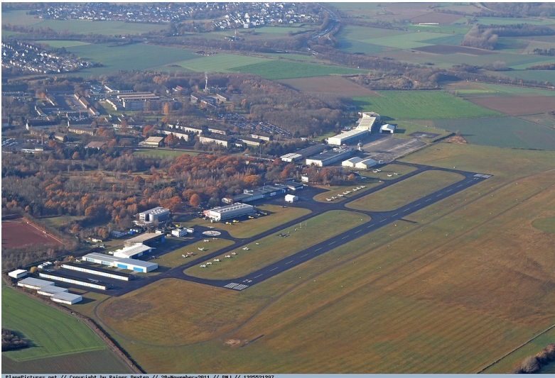
Luftaufnahme des Flugplatzes Hangelar bei Sankt Augustin aus nordöstlicher Richtung, in Hintergrund die Rheinaue bei Schwarzrheindorf (2. November 2011).