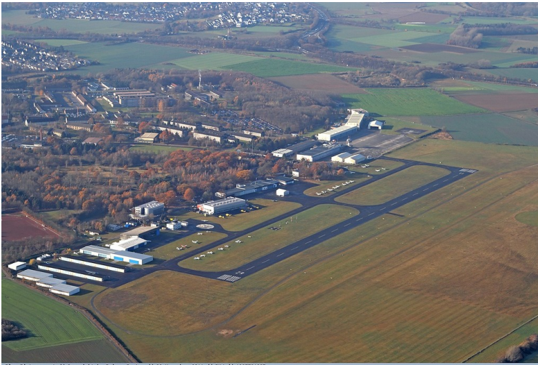
Luftaufnahme des Flugplatzes Hangelar bei Sankt Augustin aus nordöstlicher Richtung, in Hintergrund die Rheinaue bei Schwarzrheindorf (2. November 2011).