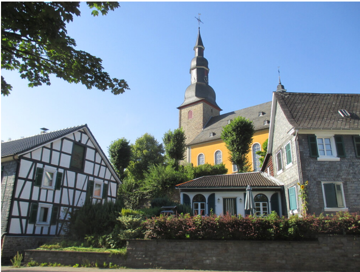
Barockkirche Eckenhagen (2015)