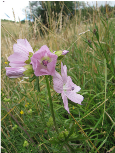
Blühende Moschus-Malve auf einer Wiese bei Bergneustadt (2016)