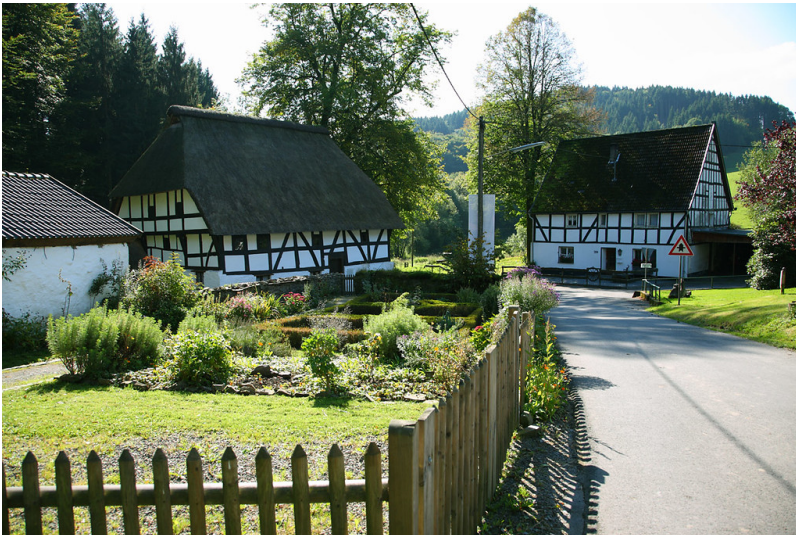
Fachwerkgebäude in Dahl (2008)