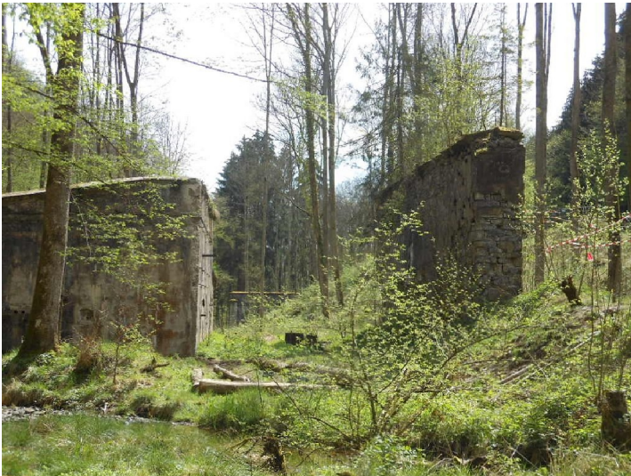
Ruinen der früheren Pulvermühle im Elisenthal bei Windeck (2013)