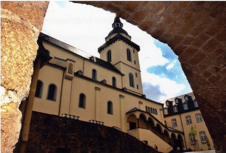
Die Siegburger Abteikirche Sankt Michael, aufgenommen vom Torhaus aus (2011). Fotograf/Urheber: keine Angabe