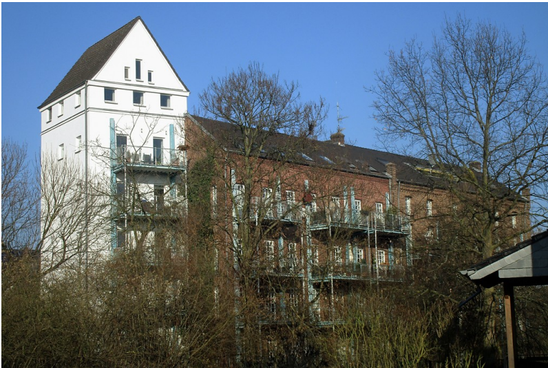
Sieglarer Mühle in Troisdorf-Sieglar, rückwärtige Ansicht vom Mühlengraben aus (2017).