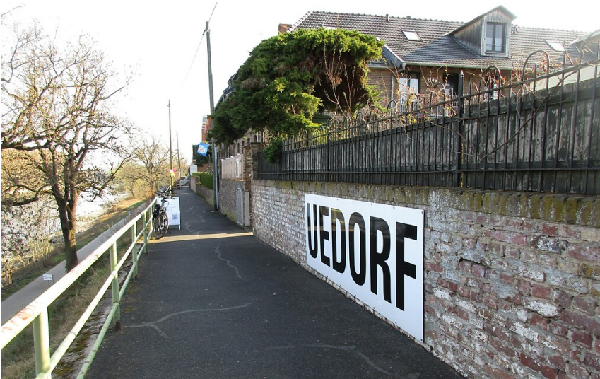
Der parallel zum Leinpfad geführte Uedorfer Rheinuferweg in Bornheim-Uedorf (2022).