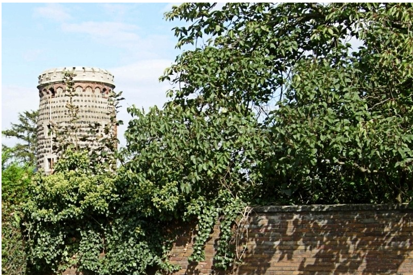
Der Mühlenturm in Bornheim-Uedorf (2007)