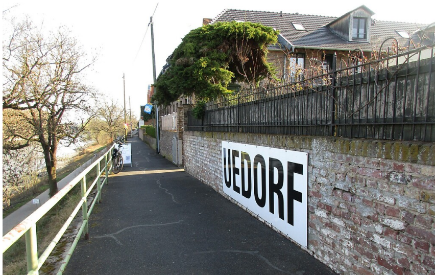
Der parallel zum Leinpfad geführte Uedorfer Rheinuferweg in Bornheim-Uedorf (2022).