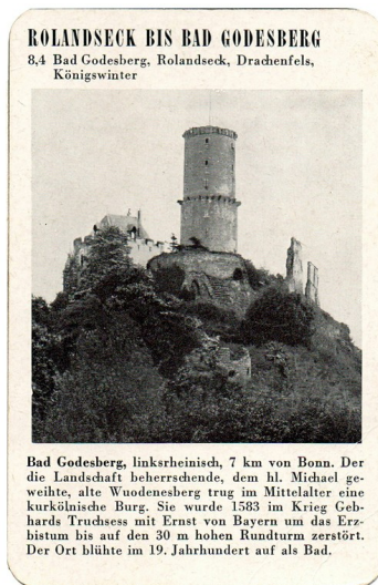
Spielkarte "Bad Godesberg" mit einer Ansicht der Godesburg (aus dem Quartettspiel "Der Rhein", Ravensburger Spiele Nr. 305, Otto Maier Verlag 1952).