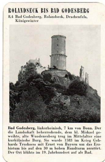
Spielkarte "Bad Godesberg" mit einer Ansicht der Godesburg (aus dem Quartettspiel "Der Rhein", Ravensburger Spiele Nr. 305, Otto Maier Verlag 1952).