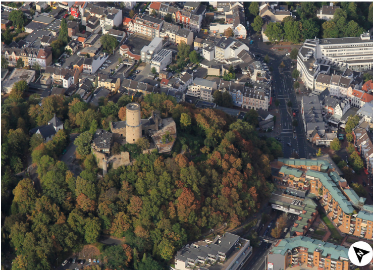
Luftbildaufnahme der Godesburg mit Nordfeil (2018)