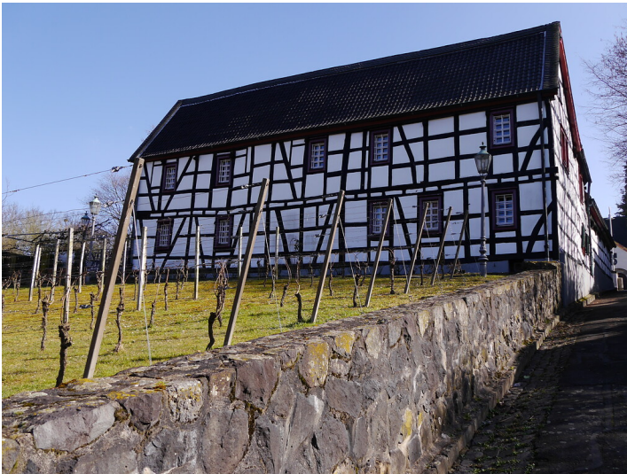
Muffendorfer Hof (2015)