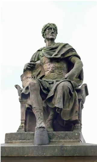
Nahaufnahme des Römerdenkmals auf dem Rheindamm bei Schwarzhof. Zu sehen ist eine Sitzstatue von Gaius Iulius Caesar (100-44 v. Chr.) als Kriegsherr (2014).