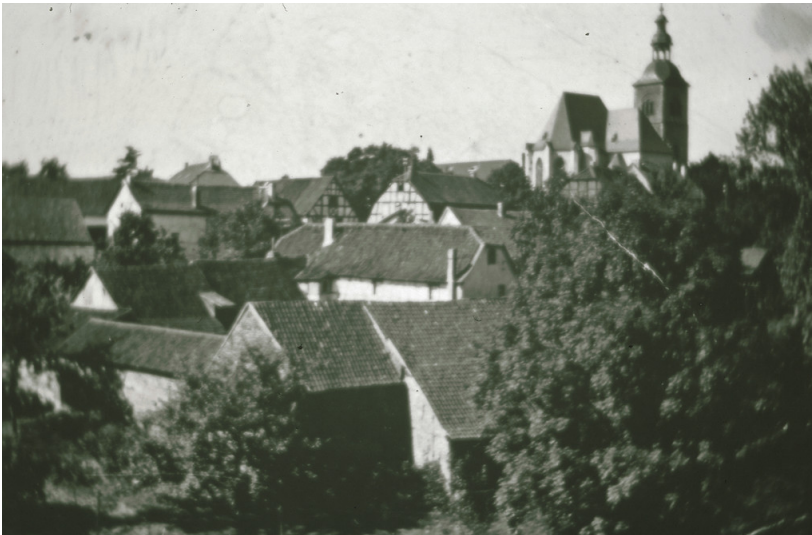
Historische Aufnahme (vor 1950) des Ortsbilds von Vilich, Blick von Nordosten