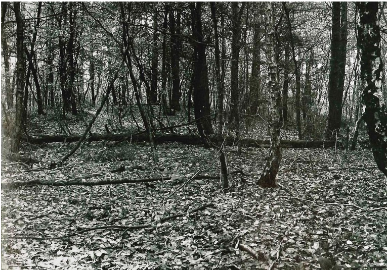
Südwestlicher Grabhügel auf dem Ennert in Bonn im Jahr 1978