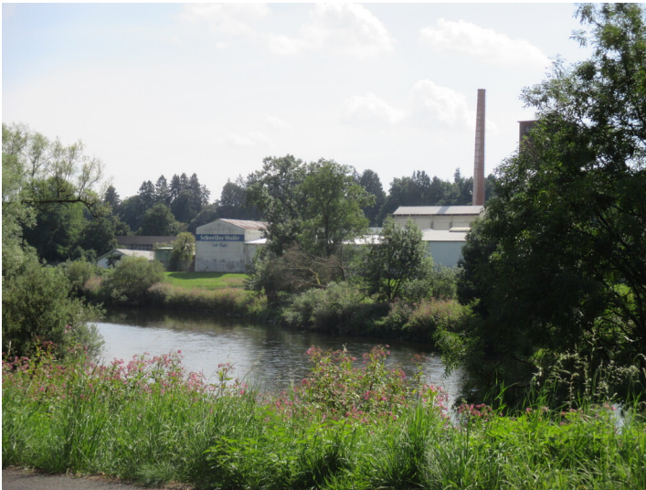
Werk "Schoeller Wolle" an der Sieg (2015)