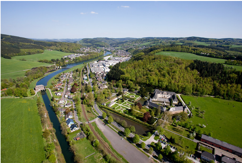
Wasserkraftwerk Ehreshoven I (Agger) und Schloss Ehreshoven, Engelskirchen (2009)