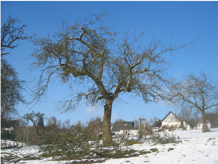
Nur durch regelmäßige Schnittmaßnahmen im Winter wie hier bei Mildsiefen, können die Obstbäume ein hohes Alter erreichen.