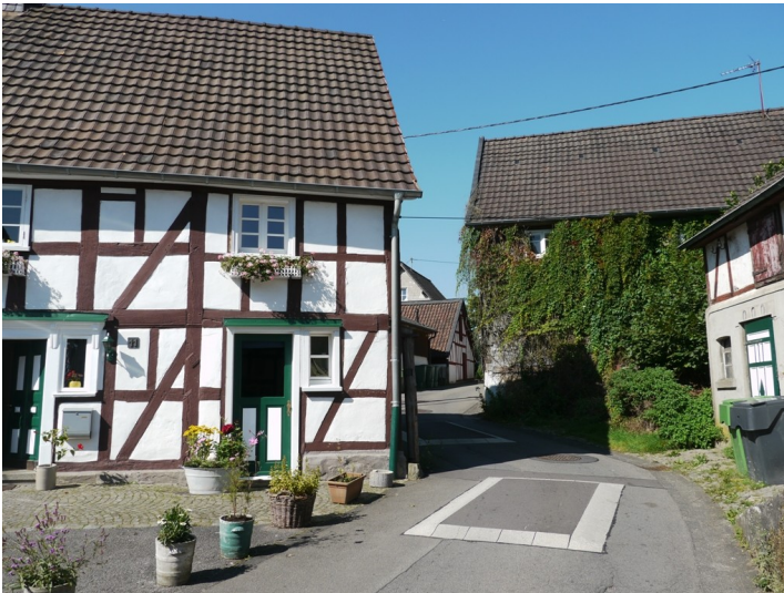
Liebevoll gepflegte Fachwerkhäuser in Diezenkausen (2013)