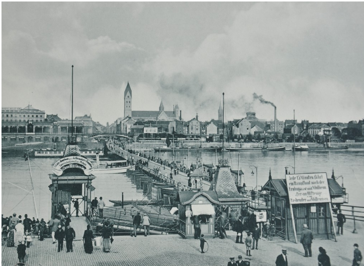
Ansicht von Deutz von der Stadtköln Seite (1896). Im Bildvordergrund der Zugang zur Pontonbrücke, auf der anderen Rheinseite links die Badeanstalt und der "Mindener Bahnhof" der Köln-Mindener Eisenbahn, rechts der Brücke Lastkähne, Sankt Heribert und die St. Johanneskirche. Mittig vor der 1892-1896 erbauten Pfarrkirche St. Heribert ist die damalige zweite Deutzer Synagoge (1786-1914) auszumachen.