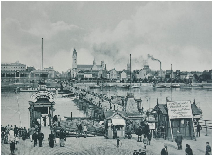
Ansicht von Deutz von der Stadtköln Seite (1896). Im Bildvordergrund der Zugang zur Pontonbrücke, auf der anderen Rheinseite links die Badeanstalt und der "Mindener Bahnhof" der Köln-Mindener Eisenbahn, rechts der Brücke Lastkähne, Sankt Heribert und die St. Johanneskirche. Mittig vor der 1892-1896 erbauten Pfarrkirche St. Heribert ist die damalige zweite Deutzer Synagoge (1786-1914) auszumachen.