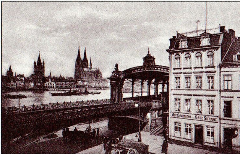
Foto-Postkarte von um 1900: Das Stammhaus der Sünner-Brauerei am "Mindener Bahnhof" der Köln-Mindener Eisenbahn in Deutz, im Hintergrund das Kölner Rheinufer mit dem Dom (aus: Zeugen Kölner Brau-Kultur 1396-1996, S. 142).