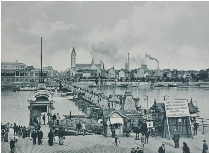
Ansicht von Deutz mit der Pontonbrücke, der Badeanstalt, dem "Mindener Bahnhof", Lastkähne, St. Heribert und St. Johanneskirche (1896).