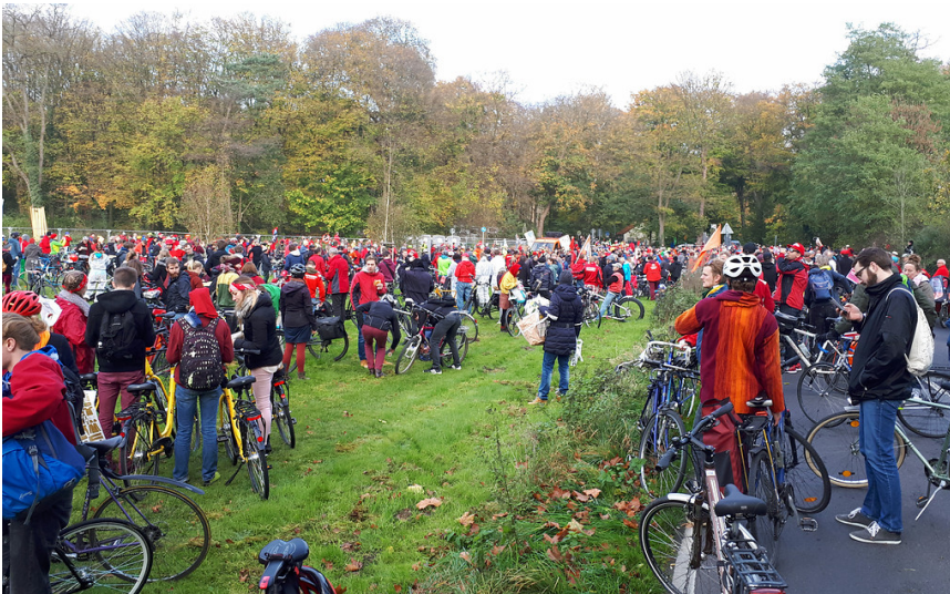
Fahrradfahrer im Wasserwerkswaldchen südlich des Volksparks und der Siedlung Volkspark in Köln-Raderthal (2017)