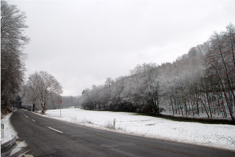
Das Lennefetal auf Höhe Keppelmühle, Lindlar (2015)