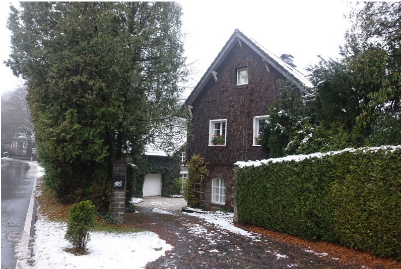
Ehemalige Getreide-, Knochen- und Pulvermühle "Junkermühle" im gleichnamigen Ort, Kürten (2015)