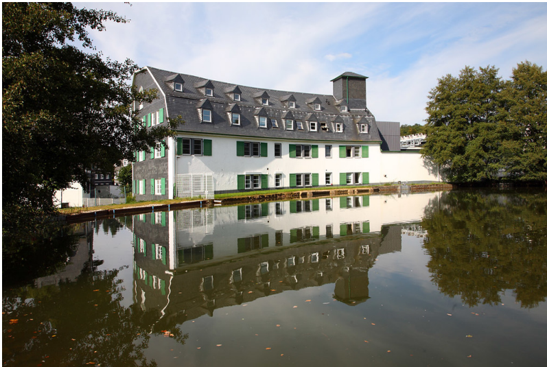
Wollager mit altem Stauteich in Niedergaul (2008)