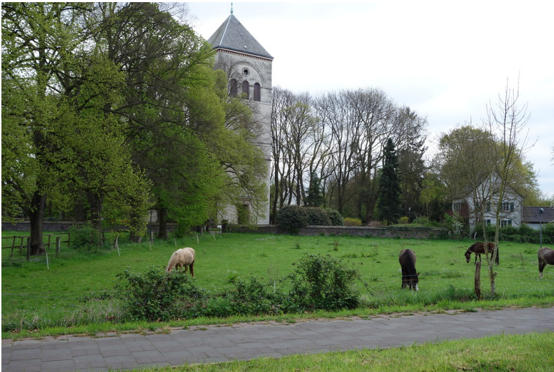
Katholische Kirche St. Gereon (2016)