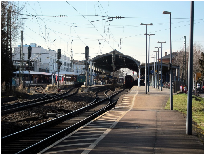
Hauptbahnhof Bonn mit der Bahnsteigüberdachung, vom Bahnsteig an Gleis 1 aus gesehen (2015).

Bundesland: Nordrhein-Westfalen, Rheinland-Pfalz