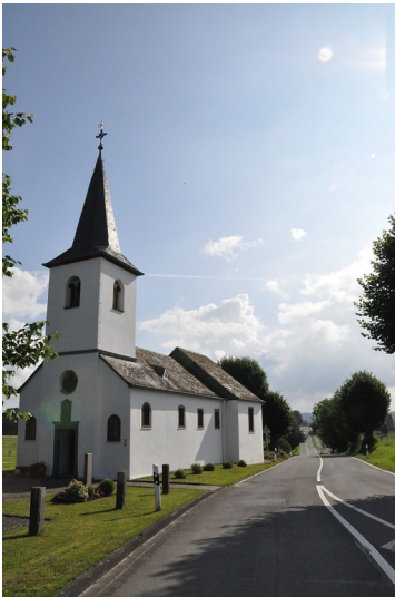
St. Rochus-Kapelle in Kemmerich, an der Höhenstraße Lindlar-Kalkofen (2014)