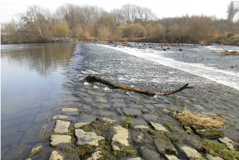
Wehr an der Agger bei Troisdorf, kurz vor der Mündung in die Sieg (2017).